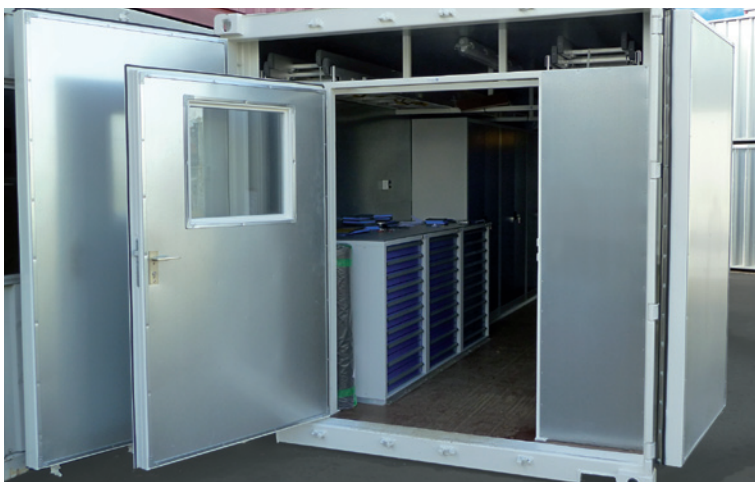
Abmessungen bis zu: L 16 m / B 4 m / H 4 m