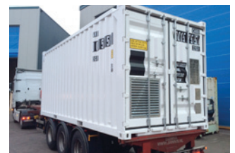
CSC- und DNV-Zertifizierung