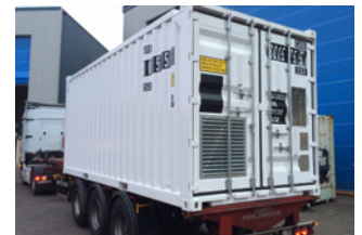
CSC- und DNV-Zertifizierung