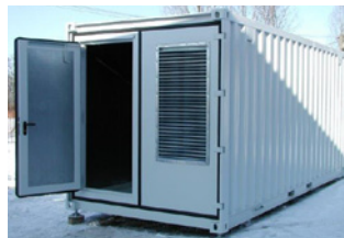
8- 20 ft Basic-Technikcontainer – pulverlackiert –